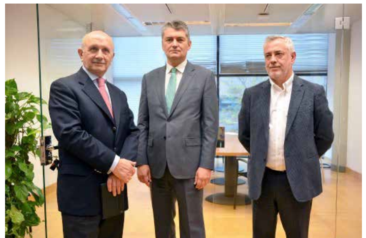
Los Presidentes del Consejo General de Enfermería y del Sindicato SATSE con el Portavoz de Sanidad de Ciudadanos

En estos momentos, en el mundo, la Enfermería asume responsabilidades en los quirófanos, en la anestesia, en los triajes de las urgencias de los hospitales... todo ello normalizado, y ello pese a que su responsabilidad supera, con mucho, la de la prescripción que, hasta hace pocos días, contemplaba el famoso decreto ley que ha sido invalidado, quizás, por movimientos corporativos de los médicos.