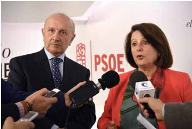
El Presidente del Consejo General con la Secretaria de Sanidad del PSOE

que concurren a las elecciones generales para informar a sus líderes de la situación y pedir su apoyo para un futuro cambio de la norma. También han comenzado una ronda de reuniones con los distintos partidos políticos.