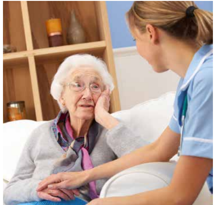
educación, la atención integral de Enfermería al anciano (art 46)

Indudablemente, la indicación técnica de las intervenciones descritas tendrá que ser valorada de forma individual para cada paciente. Lo que nos interesa aquí es preguntarnos si los profesionales que intervienen en esta historia se han parado a pensar en las implicaciones éticas y en si realmente su actuación estaba indicada, o simplemente se han dejado llevar por la rutina asistencial y la intención de curar, olvidándose de cuidar.